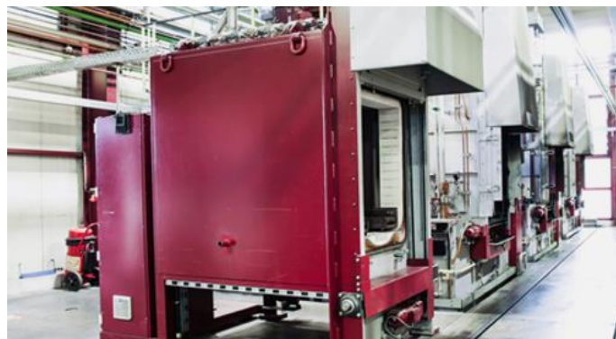
Abbildung 2: Wärmebehandlungsöfen (H + W Härte- und Werkstofftechnik GmbH Eppingen)