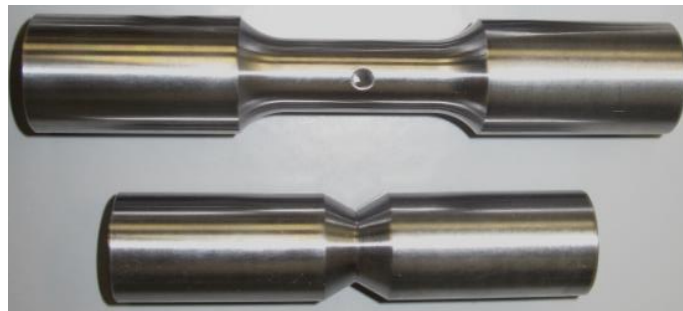
Abbildung 1. Wellenproben mit Querbohrung (oben) und mit Umfangskerb (unten)

Materialforschungs- und -prüfanstalt an der Bauhaus-Universität Weimar Postfach 2310 99404 Weimar Tel.: +49 3643 564 0 E-Mail: info@mfpa.de